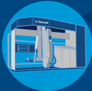
DeLaval VMS™ Series