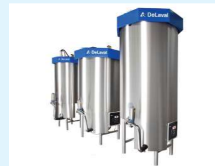
DeLaval Buffer Vessel BVV