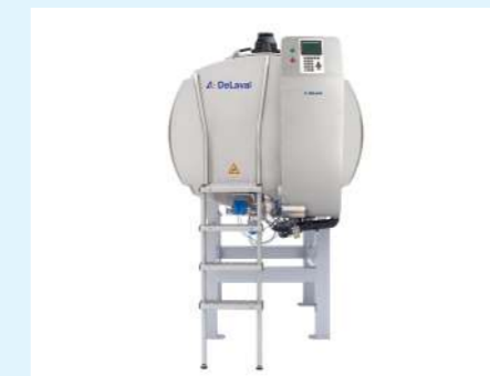
DeLaval Buffer Vessel DBV